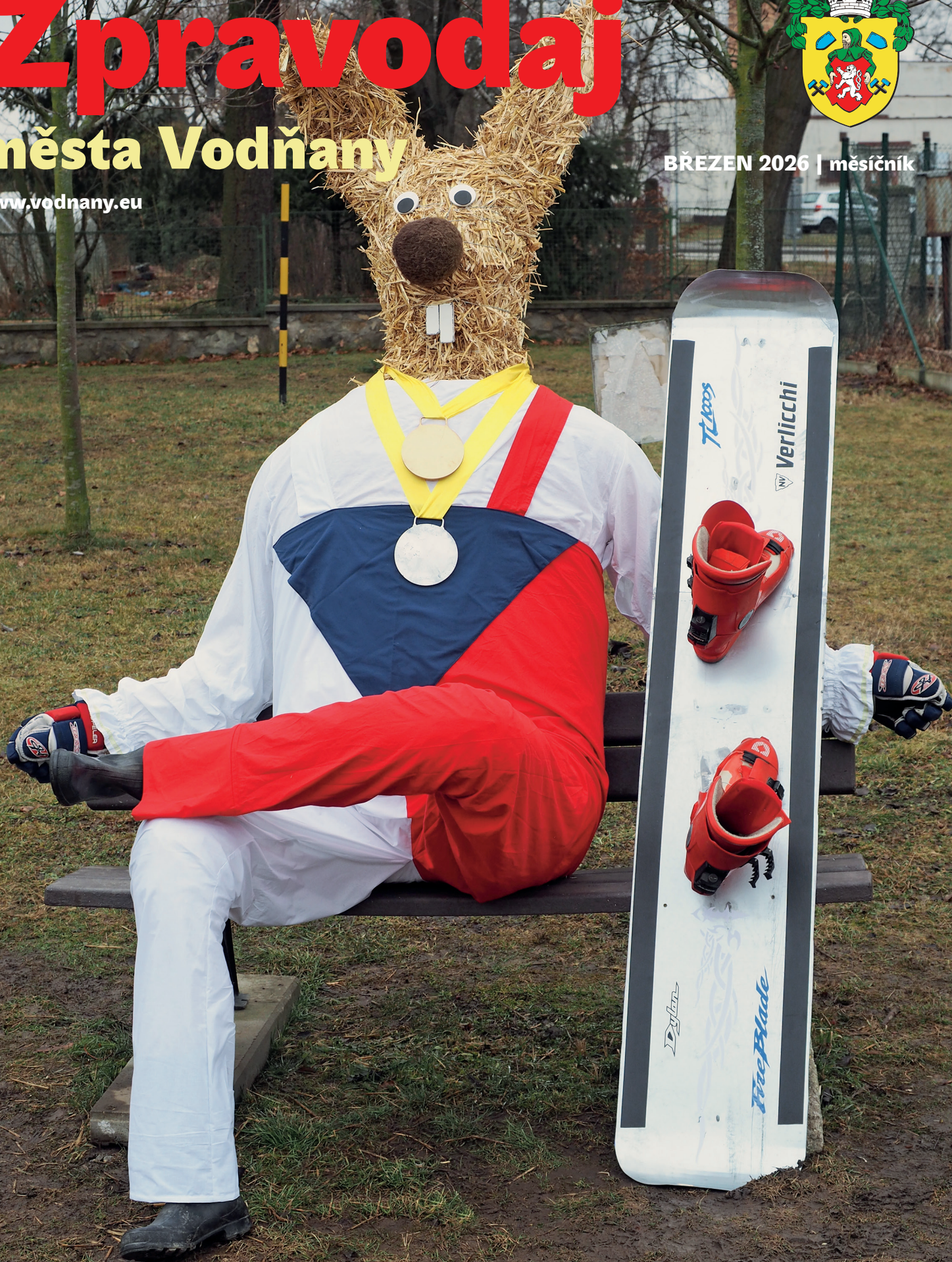
Zajíc olympionik, zlatá ve snowboardu